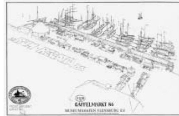
Skizze für den Gaffelmarkt aus dem Jahre 1986 (noch am Bohlwerk)