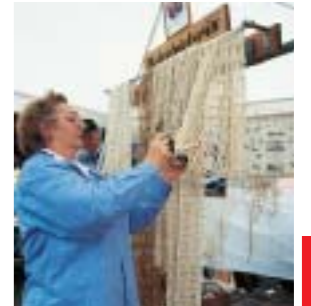
... ja, das wird eine echte Hängematte!