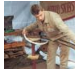
Esche kann man gut biegen ...