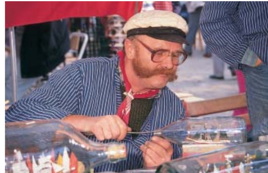
Und jetzt bloß nicht wackeln und immer schön die Zunge gerade halten, sonst werden die Masten schief...