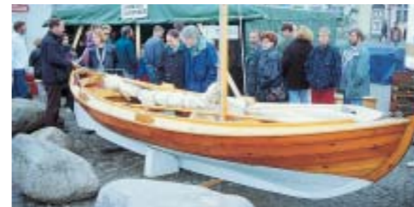
Und alles handgemacht – Staunen über norwegische Bootsbaukunst.