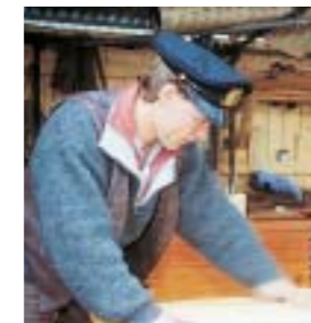
Kai baut massive Seekisten.