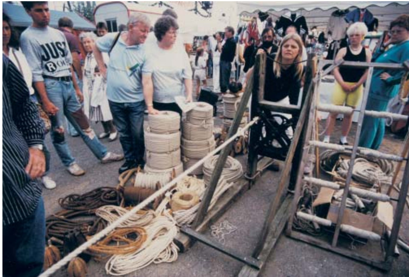
Die Reeperbahn der dänischen Reeperschlägerei aus Fur am Limfjord. Die Leine wird gedreht. Einigen Damen kommt das vertraut vor: „Wie beim Kordelmachen!“